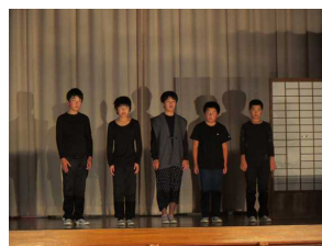
10月20日(土) 学習発表会